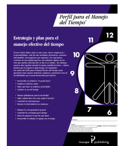
Cuadernillo de Ejercicios

Human Perspectives International, Inc. 2669 Pala Way, Laguna Beach, CA Tel: (949) 376-2814 Fax: (949) 376-2816 www.hpiintl.com - corporate@hpiintl.com