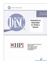
Plan de Acción DiSC 7 páginas

P.A. Ventas DiSC P.A. Servicio al Cliente DiSC P.A. Coaching DiSC P.A. Gerencia DiSC