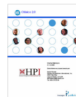
DiSC Clásico 2.0 23 páginas

Dimensión mas alta Tendencias y necesidades Ambiente preferido Como mejorar efectividad Adjetivos que lo describen Patrones clásicos