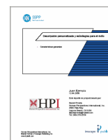
Perfil Personal DiSC 16 a 57 páginas

Fortalezas y debilidades Factores motivadores Entorno preferido Respuesta en conflicto Como mejorar efectividad Estilo de Ventas Estilo de Dirección Relación con el entorno