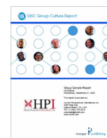
Cultura de Grupo 7 páginas

Perfil Cultura de grupo DiSC Perfil del Facilitador DiSC Visión de Grupo DiSC